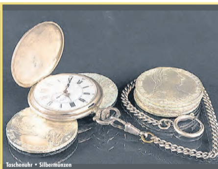
Taschenuhr • Silberkette

Goldhaus Darmstadt Ernst-Ludwig-Str. 20-22 (gegenüber Deichmann) 64283 Darmstadt Telefon: 06151 / 50 10 786 Aktionszeitraum 21.6.–26.6.2021