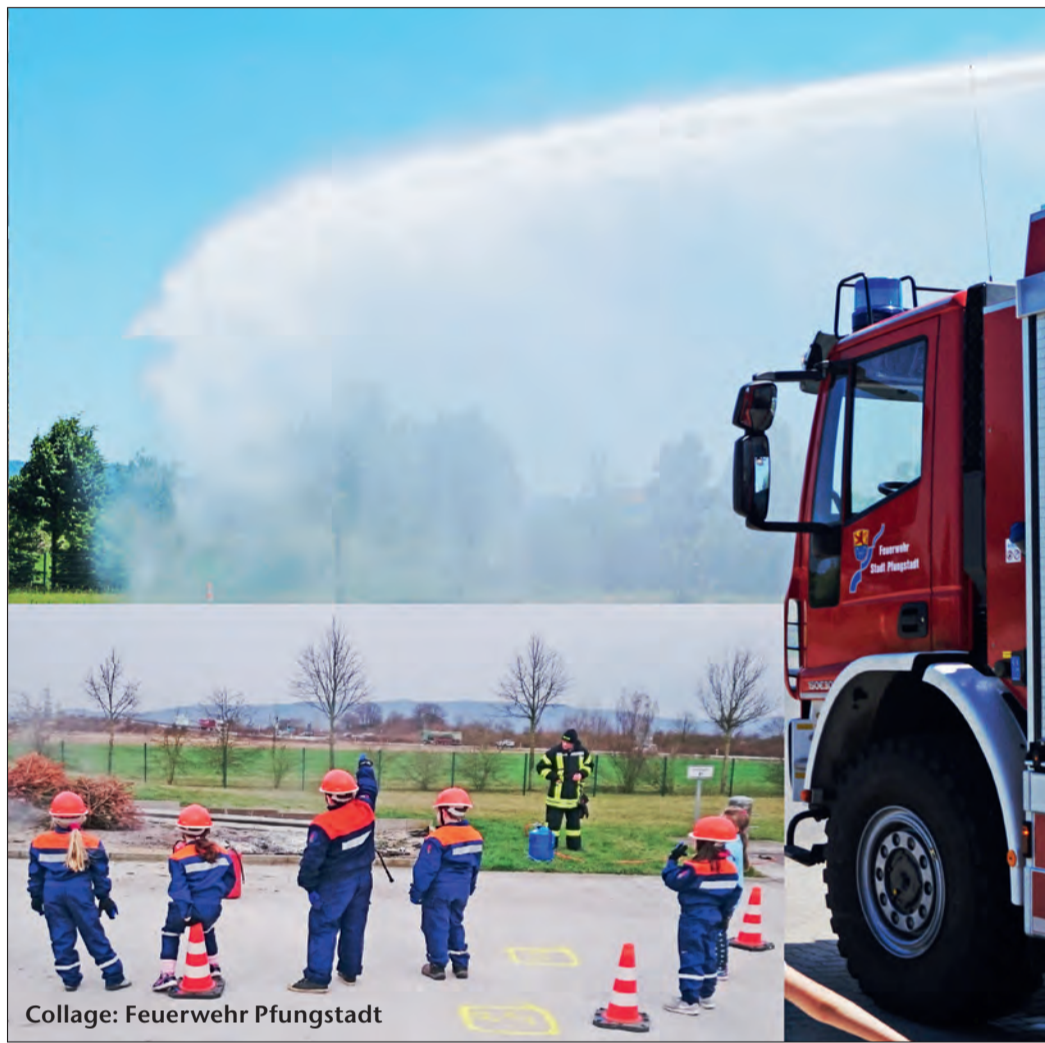
MIT SPASS BEI DER SACHE. Der Nachwuchs bei der Kinderfeuerwehr Pfungstadt. (Zum Bericht)

Kinder aus den Ortschaften Eich, Eschollbrücken und Hahn, die Lust auf die Feuerwehr haben und mit anderen Kindern in einem Team etwas Gutes tun, sowie Tolles erleben möchten, können gerne unter: info@kinderfeuerwehr-pfungstadt-west.de zu einem Schnupperbesuch angemeldet werden. Gestartet werden kann in der Kinderfeuerwehr im Alter von sechs Jahren. Die Mitgliedschaft ist kostenlos. Treffpunkt ist jeweils freitags um 16 Uhr am Feuerwehrhaus Pfungstadt-West im Floriansweg. Auf dem Programm steht basteln, malen, spielen und altersgerechtes Heranführen an die vielfältigen Aufgaben der Feuerwehr. (ng)