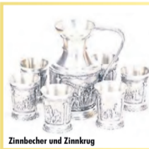
Zinnbecher und Zinnkrug