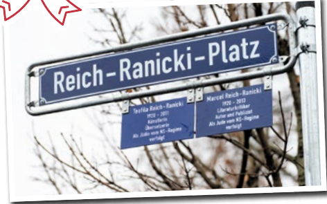
Schild des Reich-Ranicki-Platzes im Stadtteil Dornbusch.

Der Wunsch nach der Platzbenennung wurde bereits vor zwölf Jahren im Ortsbeirat formuliert. Nun sind die Schilder enthüllt – und der Anfang gemacht: Der Platz soll künftig als neue Mitte des Stadtteils gestaltet werden. Als Ort des Erinnerns an zwei Menschen, die Frankfurt geprägt haben – und hier gelebt haben.