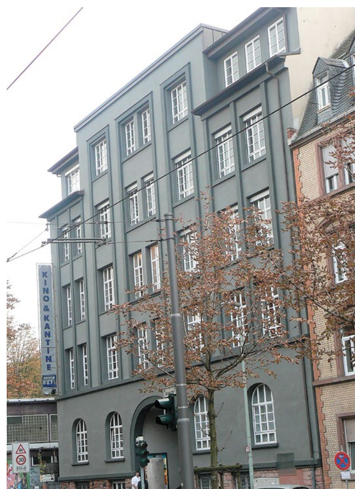
Wo Buchstaben Geschichte schrieben