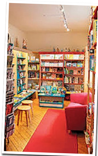
Zwischen Bücherregalen und persönlichen Empfehlungen

Einst einer der weltweit führenden Hersteller von Druckschriften, prägte sie Zeitungen, Bücher und Plakate – lange bevor Typografie zum Designtrend wurde. Heute wirkt der Ort unscheinbar, doch er erzählt von handwerklicher Präzision, technischer Innovation und der Verbindung von Kreativität und Industrie. Wer genauer hinschaut, erkennt, wie eng Bockenheim schon immer mit Wissen, Gestaltung und Gestaltungskraft verwoben war. Kein klassischer Sehenswürdigkeiten-Stopp, sondern ein Tipp für Neugierige, die verstehen wollen, warum dieser Stadtteil mehr ist als Wohnraum: ein Ort, an dem Geschichte buchstäblich aus Metall gegossen wurde.