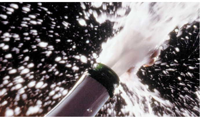
Ein schönes Ritual: Der Sektgenuss (nicht nur) zu Silvester.

FRANKFURT (RED) | Traditionell ist das Jahresende die Hochsaison für Schaumwein: Allein im Dezember werden rund 14 Prozent der Jahresmenge verkauft, mehr als die Hälfte der Deutschen genießt zu Weihnachten und Silvester Sekt, Prosecco oder Champagner. Die prickelnden Klassiker sind fester Bestandteil festlicher Rituale – und längst mehr als nur Aperitif oder Partygetränk. Dank ihrer Kohlensäure eignen sich Schaumweine hervorragend als Essensbegleiter. Frische, fruchtbetonte Varianten wie Prosecco, Cava oder junge Champagner passen ideal zu Fisch, Meeresfrüchten, Salaten und Gemüse. Länger gereifte Schaumweine, etwa Franciacorta oder Winzersekt, überzeugen mit komplexen Aromen von Brioche und Nüssen und harmonisieren besonders gut