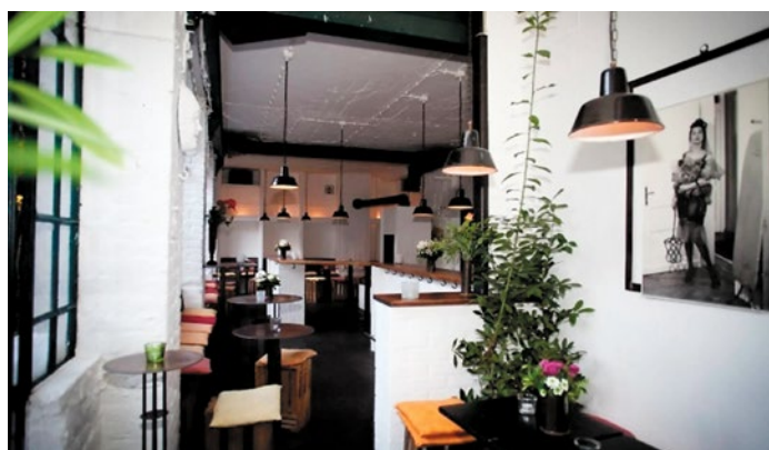
Handverlesene Weine, entspannte Gespräche und kleine Entdeckungen

B ockenheim erzählt seine Geschichten leise, aber deutlich. Zwischen historischen Fassaden und urbanem Treiben entdeckt man hier ein Frankfurt, das nicht auf Hochglanz poliert ist, sondern echte Momente bietet. Studierende diskutieren neben Nachbarn über das Weltgeschehen, Wochenmärkte treffen auf kleine Läden, und Cafés werden zu Begegnungszonen, in denen die Uhr langsamer tickt. Jeder Schritt durch den Stadtteil offenbart eine Mischung aus Tradition und Alltagsleben, die man erst versteht, wenn man sie erlebt. Bockenheim ist nicht laut, aber präsent; es verlangt kein Aufsehen, gewinnt aber, wer ihm zuhört und hinschaut. Zugezogene, Einheimische oder Besucher: Alle finden hier ihre kleinen Entdeckungen. Es ist ein Stadtteil, der lebt, nicht glänzt – und gerade deshalb so charmant wirkt.