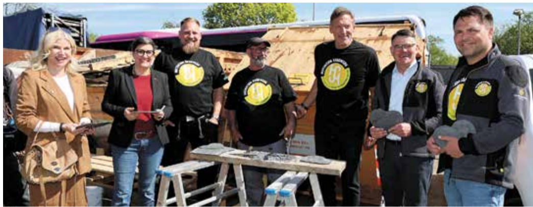
„Das goldene Abitur“ ist heute, sich einen Handwerksberuf zu suchen.