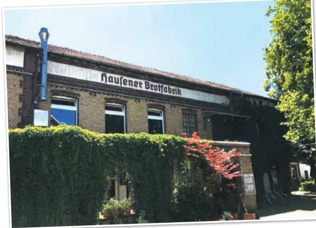
Die Brotfabrik als lebendiger Treffpunkt der Kulturszene

Als Restauranttipp im Frankfurter Westen überzeugt Seoul Pocha mit authentischer koreanischer Küche und lebendiger Bar-Atmosphäre. In dem beliebten Lokal trifft klassisches