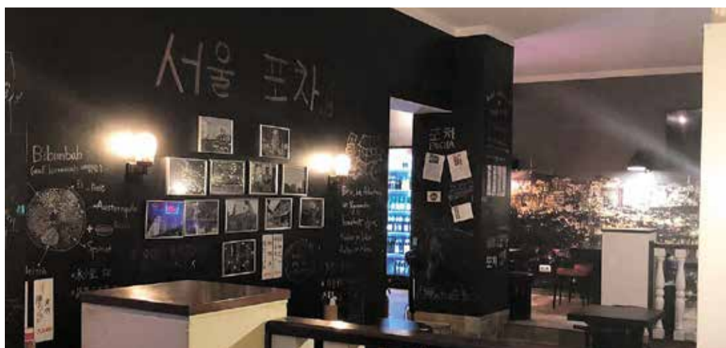
Gesellige Atmosphäre im koreanischen Streetfood-Restaurant

Der FV Hausen wurde 1920 als erster reiner Fußballverein im Stadtteil gegründet und blickt auf über 100 Jahre Vereinsgeschichte zurück. Mit viel Leidenschaft, einer starken Jugendarbeit und großem ehrenamtlichem Engagement hat sich der Verein im Frankfurter Westen fest etabliert. Zu den sportlichen Höhepunkten zählen unter anderem die Meisterschaft in der A-Klasse 2002, der Gewinn des Frankfurter Kreispokals 2012 sowie der Aufstieg in die Gruppenliga 2017. Der FV Hausen steht bis heute für traditionsreichen Fußball, Fairness und eine enge Verbundenheit mit dem Stadtteil. Den FV Hausen sowie viele weitere Vereine findet ihr auf dem MainovaSport Portal, wo sämtliche Sportangebote übersichtlich gebündelt sind: mainova-sport.de