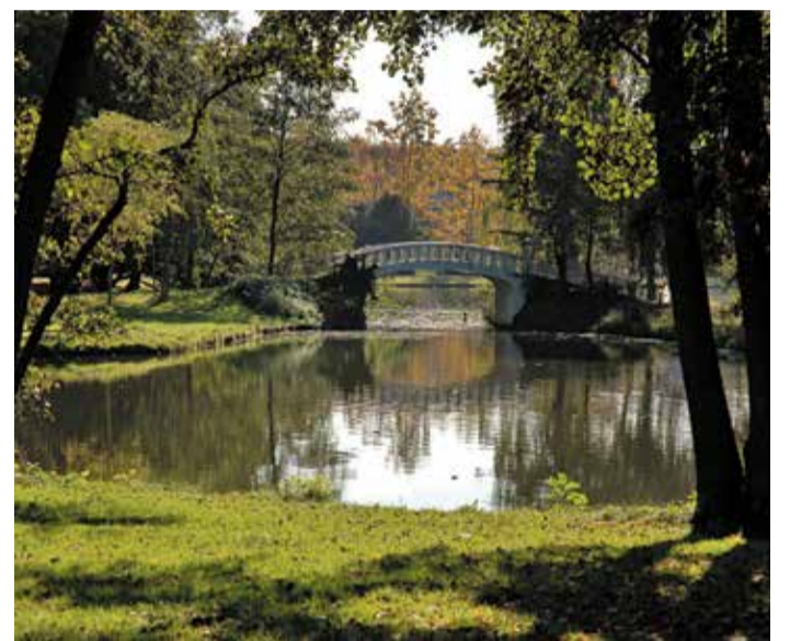
Seerosen, Bogenbrücke und alte Bäume.

ist so ein Ort. 14,6 Hektar, angelegt zwischen 1908 und 1911 auf ehemaligem Sumpfgelände – damals als Volkspark für die wachsende Industriestadt geplant, heute Landschaftsschutzgebiet und Teil des Frankfurter Grüngürtels. Der Weiher mit Bogenbrücke und Seerosenfläche ist noch immer da, der alte Baumbestand auch. Liegewiesen, Spielplatz, Kleingartenanlagen, und im Nordwesten, fast unbemerkt, der alte Höchster Friedhof. Der Park macht keine Anstalten, ein Event zu sein. Er ist einfach da, seit über hundert Jahren, und lässt die Leute in Ruhe. In Höchst ist das keine Seltenheit. Aber im Park fühlt es sich besonders richtig an.