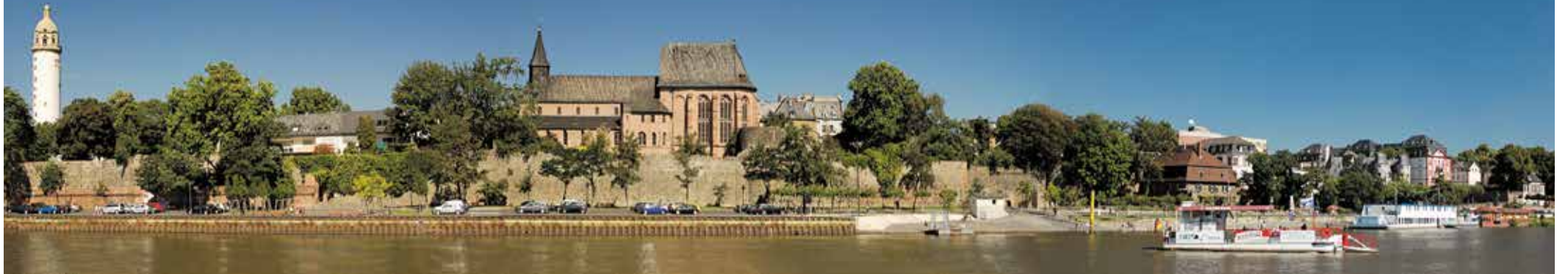
Panorama des Mainufers.

Für viele ist Höchst das, was am S-Bahn-Fenster vorbeizieht, und dabei denkt man vielleicht kurz: War das nicht irgendwas mit Chemie? Ja. Aber eben nicht nur. Wer hier aussteigt – und das tun tatsächlich Menschen –, landet in einem Stadtteil, der sich keine Mühe gibt, auf Anieb zu gefallen. Das ist keine Schwäche. Das ist Programm. Zwischen mittelalterlichem Altstadt kern, Industriepark, Main und Markt-gasse existiert ein Frankfurter Ort, der mehr Vergangenheit trägt als die meisten seiner Nachbarn und trotzdem ganz gegenwärtig funktioniert. Bolongaropalast, Fachwerk, Justinuskirche – das klingt nach Reiseführer. Ist es aber nicht. Denn Höchst macht kein Aufhebens um sein Erbe. Es lebt einfach damit. Fremde brauchen manchmal zwei Besuche, um anzukommen. Wer länger bleibt, merkt: Hier wurde nie versucht, modern zu wirken. Und genau deshalb ist Höchst auf seine eigene, unaufgeregte Art ziemlich zeitlos.