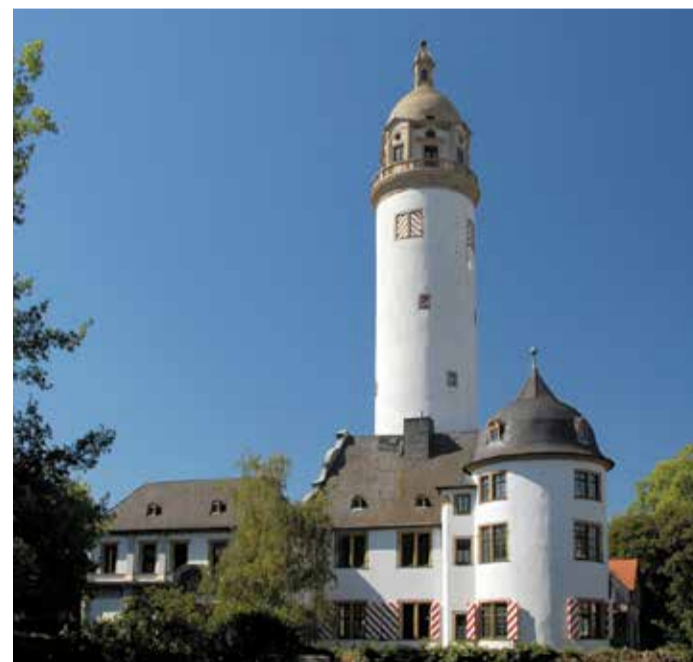
Seit dem 14. Jahrhundert steht es hier.