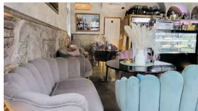
Wo Pinselstrich und Aperitivo auf Augenhöhe sind.