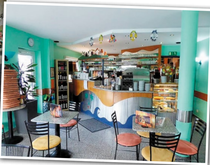
Im Sommer gehört ein Stopp beim Eiscafé Tropical für viele einfach dazu.