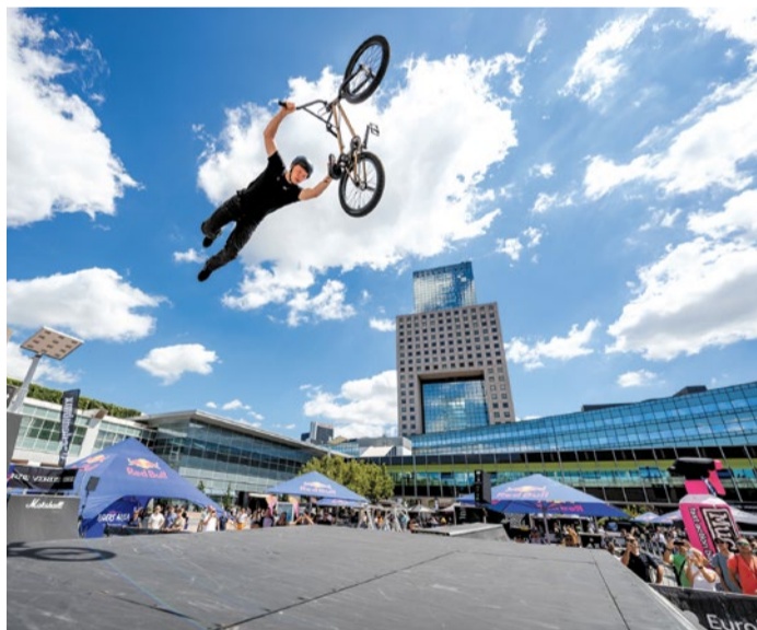
Eurobike-Festival am 27. Juni ist für alle geöffnet.

FRANKFURT/MESSE (RED/BT) | Frankfurt wird wieder zum Treffpunkt der Fahrradwelt: Vom 24. bis 27. Juni öffnet die EUROBIKE auf dem Messegelände ihre Tore. Hersteller, Händler, Entwickler und Fahrradfans präsentieren Neuheiten rund um Fahrräder, E-Bikes, Zubehör und moderne Mobilitätslösungen. Während die ersten drei Tage dem Fachpublikum vorbehalten sind, steht am Samstag, 27. Juni, das EUROBIKE Festival allen Besucherinnen und Besuchern offen. Die Messe ist längst mehr als eine Produktschau. Im Mittelpunkt stehen nachhaltige Mobilität, Radreisen, urbane Verkehrskonzepte und das Fahr-