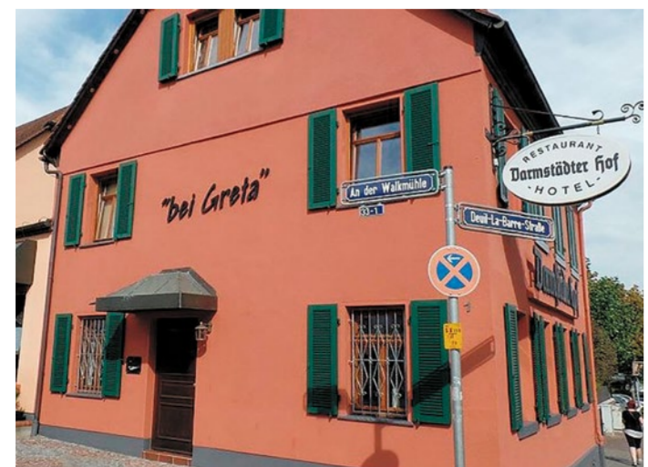
Ein Ort für gutes Essen – und für alles, was einen Stadtteil zusammenbringt

Der Pfingstwald gehört zu den Orten, die Nieder-Eschbacher gerne für sich behalten würden. Kein spektakuläres Ausflugsziel, kein Freizeitpark, kein Ort für große Inszenierungen. Genau deshalb funktioniert er so gut. Zwischen Wegen, Wiesen und altem Baumbestand finden Spaziergänger, Jogger und Radfahrer einen unkomplizierten Rückzugsort direkt vor der Haustür. Besonders an warmen Tagen wird deutlich, wie wertvoll solche Grünflächen für einen Stadtteil sind. Hier trifft man Hundebesitzer, Familien und Menschen, die einfach eine Run-