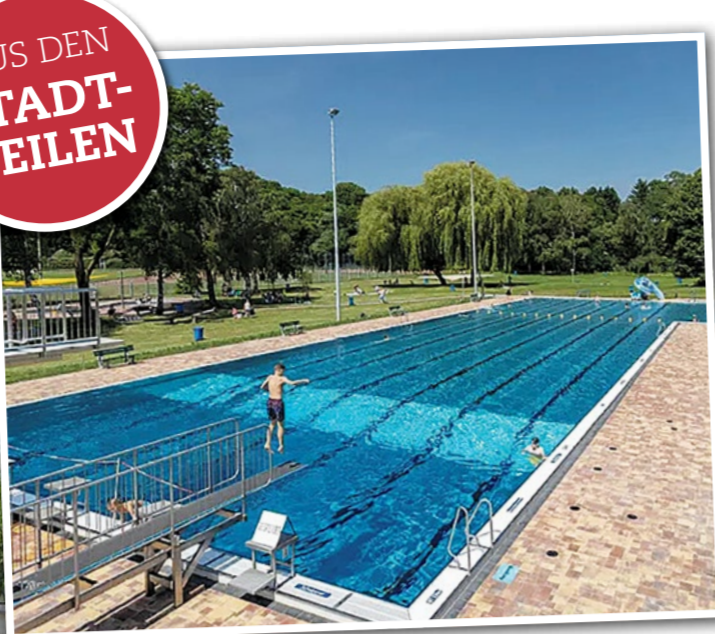
Hier beginnt der Sommer mit einem Sprung ins Wasser