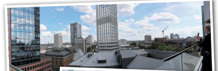
Panoramablick vom Taunusturm.

Die Resonanz war entsprechend groß. Für viele Besucher steht schon jetzt fest: Beim nächsten Rooftop Day wollen sie wieder dabei sein – ganz oben über den Dächern der Stadt.