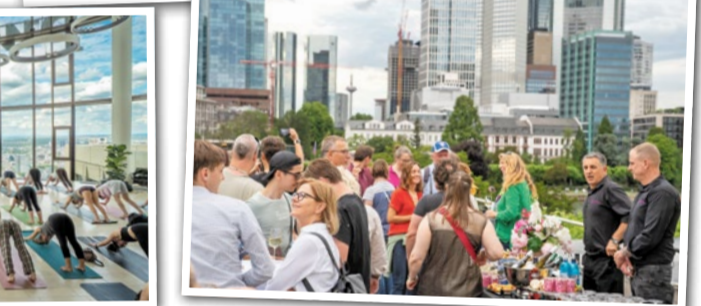
Rooftop Day auf dem Dach des Museums für Kommunikation.