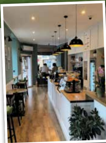
Triftstraße 18 – in Niederrad mittlerweile kein Geheimtipp mehr. Zu Recht.

Wer in Niederrad nach Fine Dining gesucht hat, hat bis vor kurzem meistens woanders gegessen. MoTaKi hat das geändert. Das Restaurant versteht sich als asiatisches Fine-Dining – und