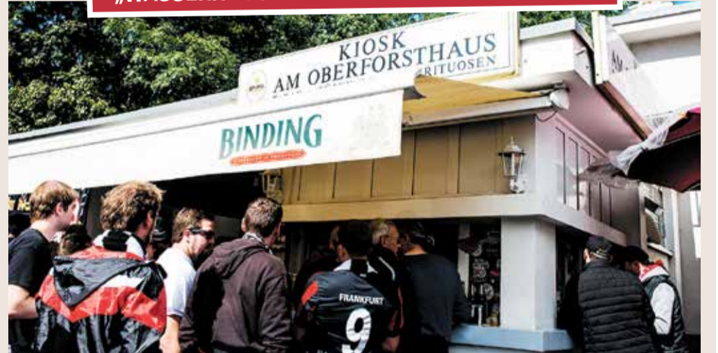
Dieser Kiosk am Oberforsthaus ist ein ganz besonderer Ort, denn diese Fensterscheibe öffnet sich exklusiv zu den Eintracht-Spielen. Es ist ein beliebter Treffpunkt für alle Eintracht Frankfurt Fans.