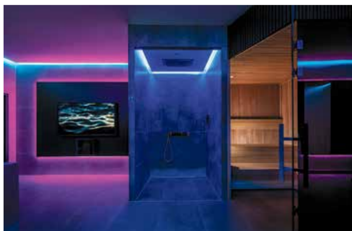
Whirlpool, Sauna, Stille – Entspannung ohne Warteschlange.

Die Niederräder Turngesellschaft sowie viele weitere Vereine findet ihr auf dem MainovaSport Portal, wo sämtliche Sportangebote übersichtlich gebündelt sind: www.mainova-sport.de