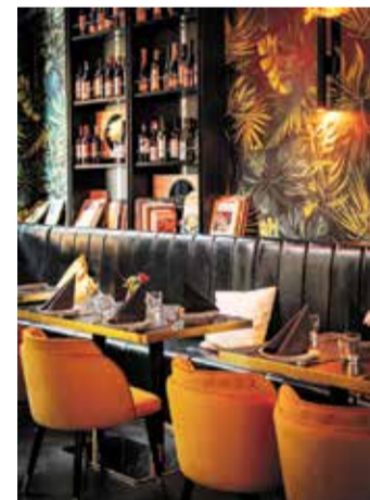
Asian Fusion trifft auf entspannte Nachbarschaftsatmosphäre.

Konzept ist so einfach wie konsequent: private Wellbase buchen, ankommen, abschalten. Keine Warteschlange im Saunagang, kein Gedränge am Whirlpool, kein Handtuch-auf-Liege-Reservieren. Stattdessen: eigener Whirlpool, finnische Sauna, Erlebnisdusche, Chillout-Lounge, Massagesessel – und für alle, die entspannen und trotzdem gewinnen wollen: auch eine Xbox. Wellext wurde aus einer klaren Idee heraus gegründet: Spa unkompliziert, persönlich und für alle erlebbar machen, ohne dabei auf Qualität zu verzichten. Das gelingt. Ob zu zweit, allein oder mit Freunden – Wellext funktioniert als echter Rückzugsort. In einer Stadt, die ständig mehr verlangt, ist das keine Kleinigkeit.