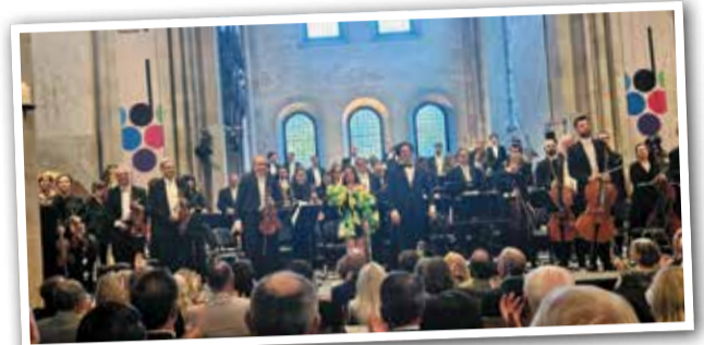
Eine formidable Performance - Das hr-Sinfonieorchester mit Solistin Lucienne Renaudin Vary im Kloster Eberbach.