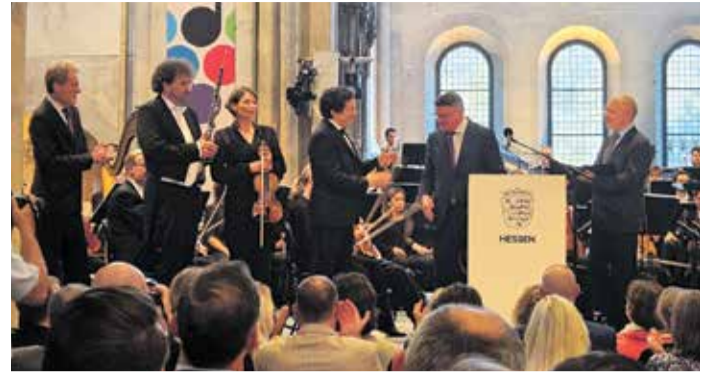
Ministerpräsident Boris Rhein überreichte den Hessischen Kulturpreis 2025 an das hr-Sinfonieorchester Frankfurt.

Auch Kunst- und Kulturminister Timon Gremmels würdigte die Bedeutung des Ensembles. Mit Konzerten, internationalen Gastspielen und seiner Musikvermittlung prägte das hr-Sinfonieorchester das kulturelle Leben in Hessen und mache klassische Musik für ein breites Publikum erlebbar.