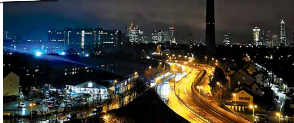
Beleuchteter Europaturm bei Nacht.