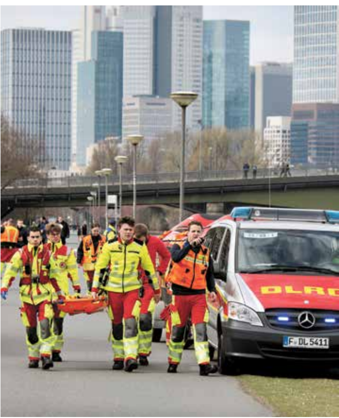
Der DLRG im Einsatz für die Frankfurter.