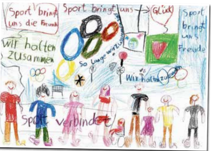
Kreative Ergebnisse, die 2024 gewonnen haben.