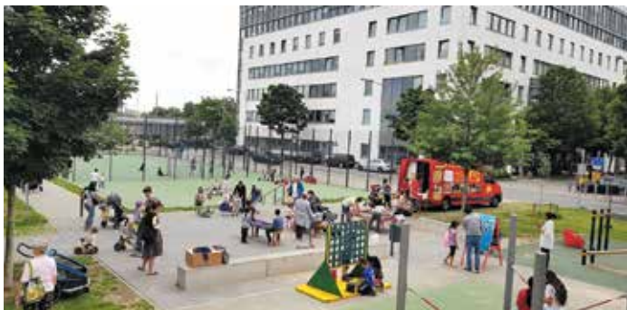
Das Spielmobil im Galluspark.

der einfallen lassen. Slackline, Bewegungsparcours, Basteln, Werken und vieles mehr! Bald geht es wieder los! Aktuell befinden sich die Spielmobile noch in der Winterpause und sind spätestens ab Anfang April 2026 wieder in den Stadtteilen, auf Grünflächen, öffentlichen Plätzen und Schulhöfen, unterwegs. Vorschläge und Anregungen für die Stationen der Spielmobil-Tour 2026 nimmt die Geschäftsstelle des Vereins unter Tel. 069 / 90 47 50 70 oder per E-Mail an info@abenteuerspielplatz.de entgegen.