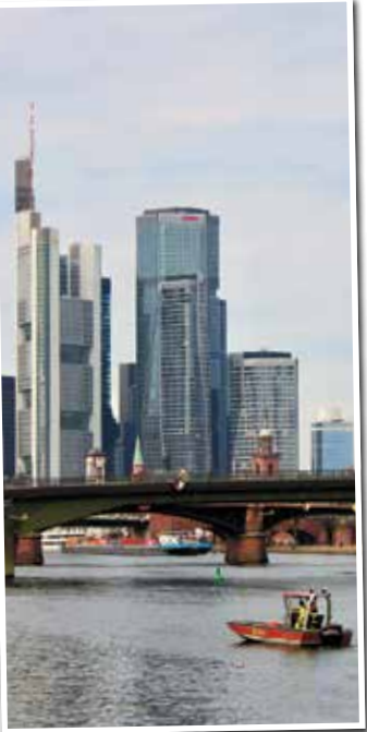
Der DLRG im Einsatz für die Frankfurter.