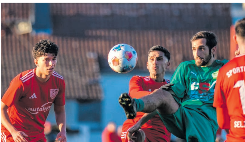
Nach der Heimmiederlage gegen Groß-Gerau wollen die Sportfreunde beim FC Kalbach punkten, um weiter im Titelkampf zu bleiben.

eine kleine Wundertüte. Der SV muss auf der Hut sein. Die SpVgg. Seligenstadt empfängt am Sonntag zum Spitzenspiel den Tabellenzweiten Germania Bieber. Beide Teams stecken in einer kleinen Formkrise. Beide Mannschaften holten aus den letzten vier Spielen nur einen mageren Zähler. Die Blauen wollen den Heimvorteil nutzen und endlich wieder dreifach Punkten, um weiter oben dran zu bleiben. Alex Tretin, Trainer der Blauen: „Angeschlagene Boxer sind bekanntlich am gefährlichsten. Heißt, wir müssen schauen, dass wir raus kommen aus der schweren Situation. Die Spielklasse zeigt uns, wie nahe alles zusammen liegt. Die Aufgabe wird nicht leicht, da Bieber auch in der Pflicht ist Germania Klein-Krotzenburg hat einen Lauf. Drei Siege in Folge machen Mut und bringen Selbstvertrauen. Beides werden