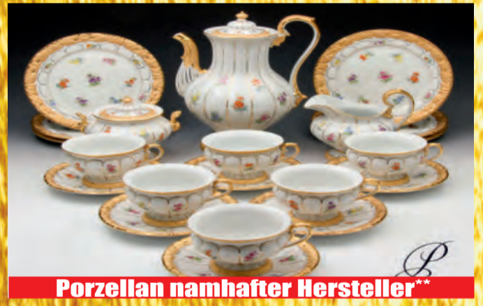
Porzellan namhafter Hersteller**