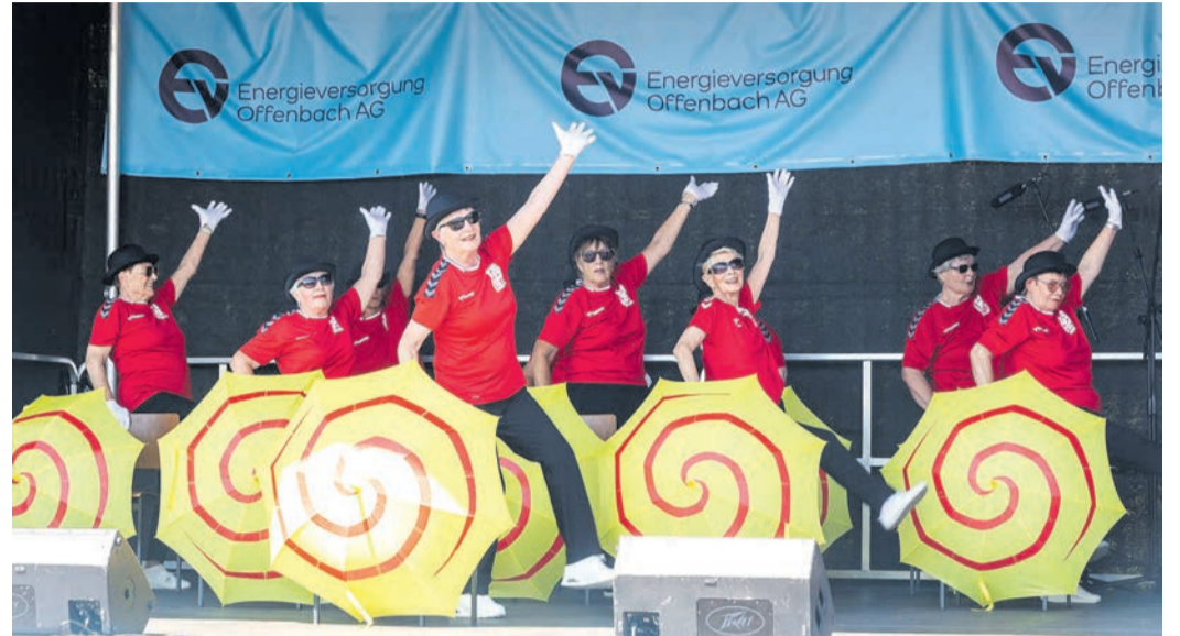
Die Vorführung der „Stuhl-Gang“ der TGS Seligenstadt zeigte, wie man auch im Alter mobil bleiben kann.