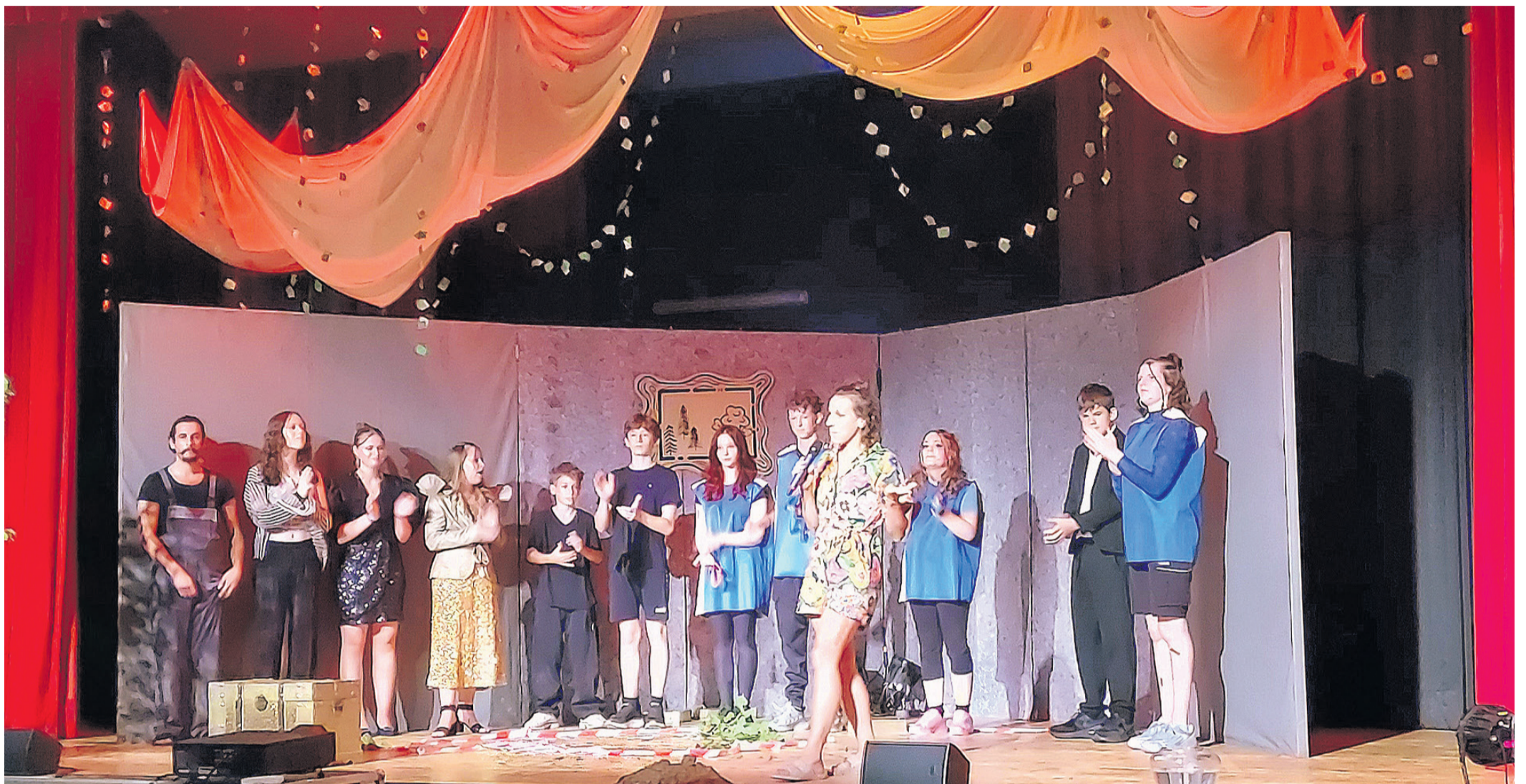
Die Schülerinnen und Schüler der Freien Schule begeisterten bei der Premiere ihres selbst entwickelten Umwelt-Theaterprojekts mit einer kreativen Mischung aus Schauspiel, Tanz, Musik und beeindruckenden Bildern zum Thema Klimawandel und Zukunft.