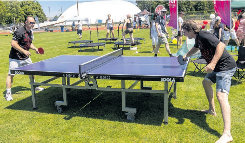
Viele Angebote konnten direkt ausprobiert werden.