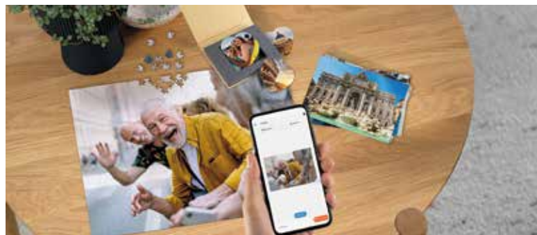
Fotos, die Geschichten erzählen: Mit etwas Kreativität zaubert man aus Schnappschüssen individuelle Präsente.