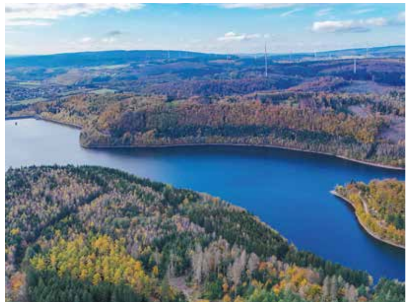
Die Talsperre Nonnweiler ist das größte Trinkwasserreservoir im Saarland und Rheinland-Pfalz.

Um unseren Vorfahren noch näher zu kommen, bietet es sich an, den Besuch des Ringwalls Otzenhausen mit einer Wanderung zu verbinden. Auf der 11,4 Kilometer langen „Traumschleife Dollbergschleife“ stiefelt man durch ruhige, unberührte Nationalpark-Wälder – perfekt, um sich wie die Kelten eng mit der Natur verbunden zu fühlen. Eine moderate Steigung führt auf den 693 Meter hohen Dollberg, den höchsten Berg im Saarland. Oben angekommen schweigt der Blick in die Ferne über ein rot-gelb-leuchtendes Blätterdach, und die Herbstsonne spiegelt sich im Wasser der fjordartig anmutenden Talsperre Nonnweiler. Das größte Trinkwasserreservoir im Saarland und Rheinland-Pfalz hat man zuvor passiert, genauso wie die Wiege der saarländischen Eisenindustrie: den rekonstruierten Züscher Hammer, ein Eisenhüttenwerk aus dem 17. Jahrhundert. Wer die erste Tour geschafft hat, findet unter www.nonnweiler.de weitere Wanderwege, die zu Entdeckungstouren rund um den Saar-Hunsrück-Steig einladen. Die Hubertusrunde beispielsweise gibt einen anderen Blick auf die Talsperre frei, führt über schmale Pfade durch alte Buchenbestände und entlang der Prims und des Forstelbachs. Nach den Wanderungen gibt es leckere Hausmannskost in einer der lokalen Gaststätten.