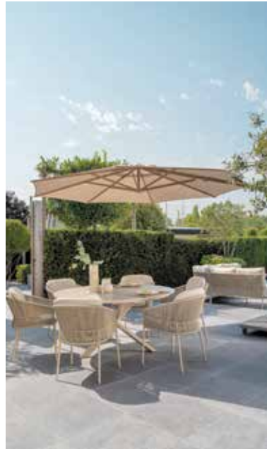
Zum Genießen unter freiem Himmel tragen bequeme Stühle mit hohem Sitzkomfort bei.