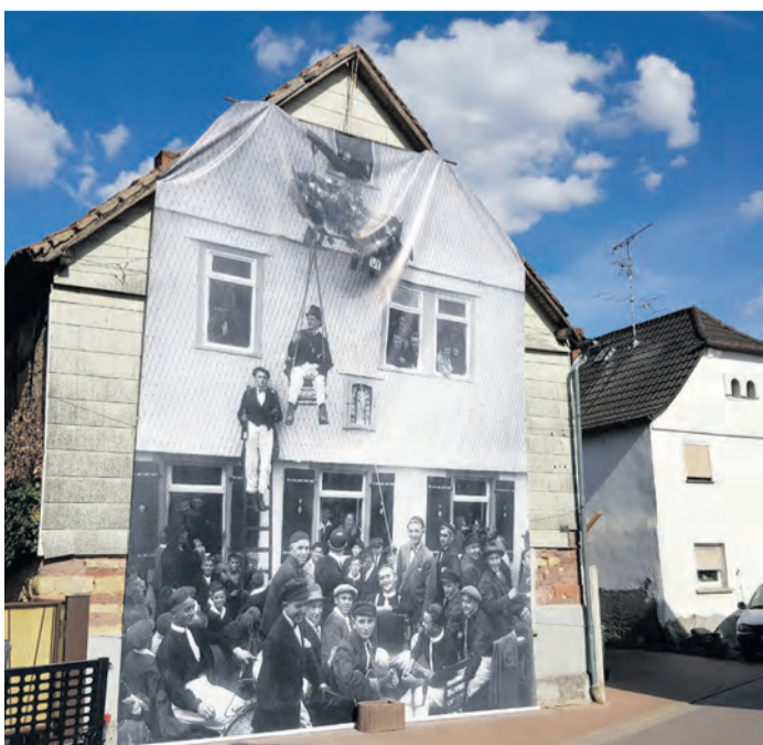
Die ehemalige Gaststätte „Zum Grünen Baum“ nimmt in der OWK-Geschichte einen hohen Stellenwert ein: Hier wurde der Verein gegründet und 100 Jahre später, also 2019, an der Hauswand des nicht mehr existierenden Lokals ein riesiges Foto-Banner aufgehängt.

bel net will, dann heier ich die Lies“ oder „Alleweil rappelt's am Scheiertor“ freuen. Diese dürften zur Stimmung und für ganz viel Reminiszenzen sorgen. Karten für den Heimatabend am 25. April um 20 Uhr in Eppertshausen gibt es für 15 Euro im Geschäftshaus Sperl sowie auf der Gemeindeverwaltung.