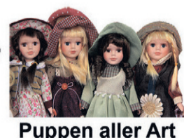
Puppen aller Art