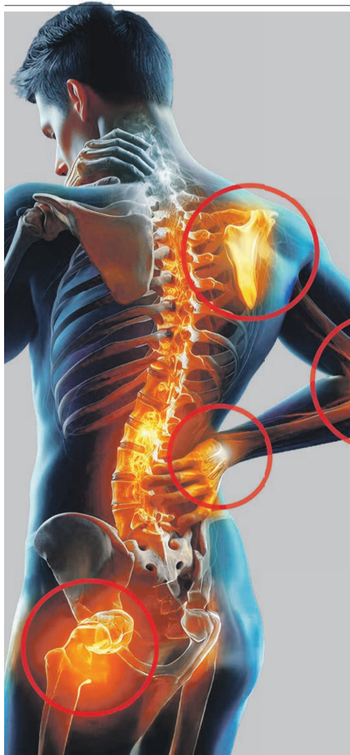
Abbildung Betroffenen nachempfunden