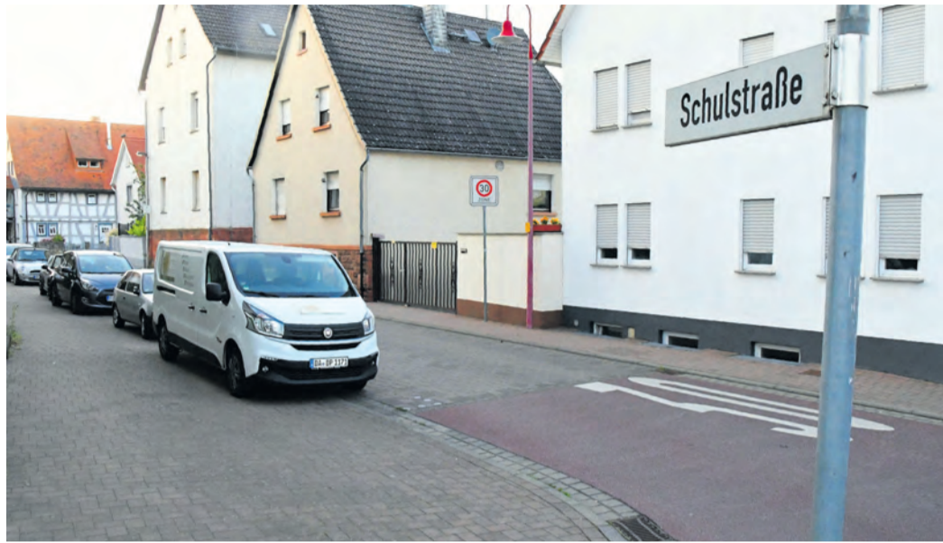
Die Eppertshäuser Schulstraße (Foto) wird wie die Bahnhof- und die Friedhofstraße wahrscheinlich nicht zur Fahrradstraße.

Eppertshausen (jedö) Werden die Schulstraße, die Friedhofstraße und die Bahnhofstraße in Eppertshausen künftig zu „Fahrradstraßen“? Dies hatte im Dezember 2024 in der Gemeindevertretung die CDU-Fraktion angestoßen. Nun, in der ersten Arbeitssitzung des neu besetzten Parlaments, kam das Thema wieder auf die Tagesordnung. Zwischenzeitlich hat die Gemeinde den Sachverhalt geprüft und auch Geschwindigkeitsmessungen in zwei der drei Straßen durchgeführt. Passé ist der Plan, Radfahrern das Leben dort sicherer und leichter zu machen, zwar noch nicht; nach der Umsetzung des ursprünglichen Ansinnens sieht es aber nicht mehr aus.