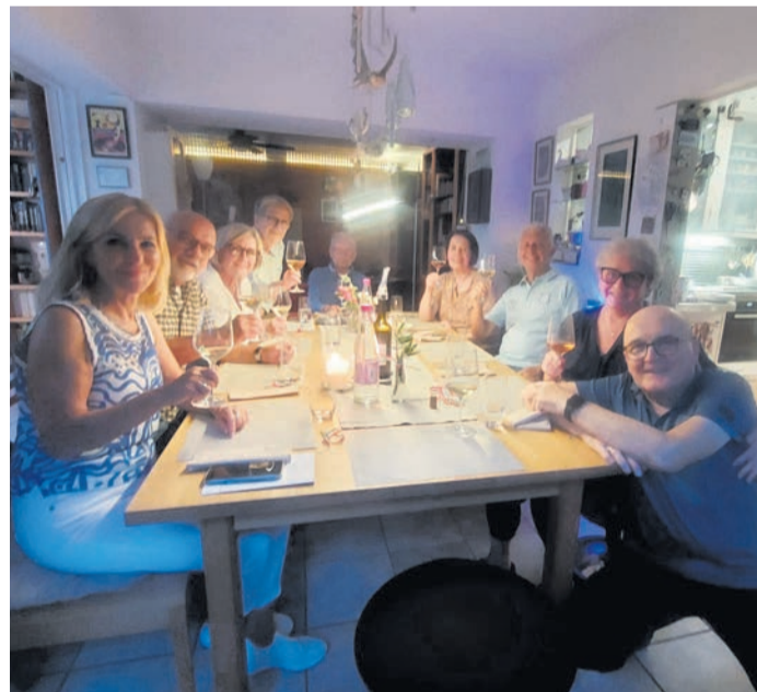
Kulturelle Tischrunde der Serata Italiana

Begleitet wurden die Speisen von ausgewählten Weinen aus