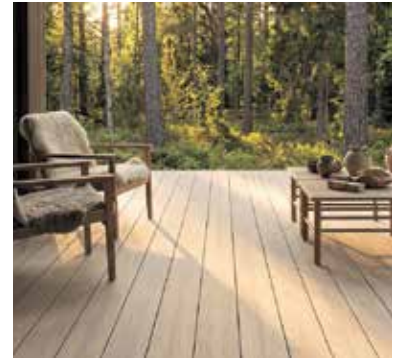
Warme Oberflächen und natürliche Töne lassen die Stimmung des Waldes näher an die Terrasse rücken.

Streichen entfällt. Auch unter Sonneneinstrahlung vergraut der Werkstoff in der Regel nicht so wie Holz. Hinzu kommt das Wärmeverhalten: Die Dielen speichern Wärme gut, heizen sich aber meist deutlich weniger auf als Naturstein, Beton oder Keramik und bleiben damit für Barfußläufer angenehmer. Möglich wird das durch den Werkstoff GCC Holzart. Er bewahrt die positiven Eigenschaften des Naturmaterials, ist aber zugleich so verarbeitet, dass er im Außenbereich widerstandsfähiger ist. Der hohe Anteil von 75 Prozent Naturfasern wird durch Polymere und Additive ergänzt. Nach Herstellerangaben spricht auch der Nachhaltigkeitsaspekt für das Material: Die verwendeten Holzfasern stammen aus Restholz der Hobel- und Sägeindus-