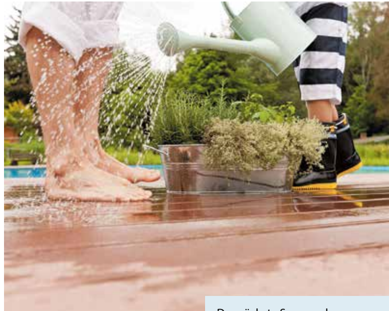
Robuste Beläge für Wege und Terrassen

Auch Wildblumenwiesen erweisen sich als strapazierfähiger als klassischer Zierrasen, der in Dürreperioden schnell Schaden nimmt. Ergänzend trägt das Sammeln von Regenwasser, ob in Tonnen oder unterirdischen Zisternen, zu einem resilienten Garten bei.