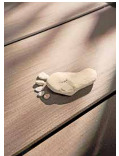
Splitterfreie Terrassendielen sind für Barfußläufer eine Wohltat.

flächen im Sommer aufheizen. Stein- und Betonflächen speichern Hitze oft lange und können barfuß schnell unangenehm werden. Verbunddielen erwärmen sich je nach Material und Farbe häufig weniger stark. Hersteller wie megawood verweisen außerdem darauf, dass moderne Holzwerkstoffe ohne PVC oder Weichmacher auskommen, auf Kreislaufführung ausgelegt sind und hohe ökologische Standards erfüllen. Unter www.megawood.com etwa finden sich ausführliche Informationen sowie ein interaktiver 3D-Terrassenplaner. Auch die Lebensdauer der Systeme ist entscheidend: Je länger ein Terrassenbelag nutzbar bleibt, desto geringer fallen Ressourcenverbrauch und Folgekosten aus. So lässt sich der Garten an veränderte klimatische Bedingungen anpassen, ohne gestalterische Ansprüche aus dem Blick zu verlieren.