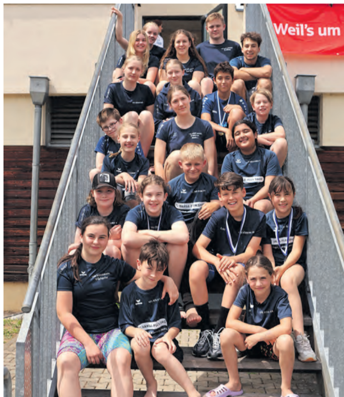
Die Teilnehmer des VFS Rödermark beim Sprintwettkampf.

„Das ist sehr gut. Da sind wir wirklich froh über die große Resonanz“, freute sich der VFS-Vorsitzende Sirko Ogriseck über die Teilnehmerzahlen. Noch etwas mehr Statistik: Am Samstag gingen beim 26. Sprintwettkampf 190 Teilnehmer aus elf Vereinen ins Wasser. Mit 732 Einzel- und Staffelsstarts war das Teilnehmerfeld stark besetzt. Der VFS selbst stellte 24 Aktive (106 Starts). Bei schwülwarmen Temperaturen und nur wenigen Regentropfen konnte das Außengelände des Badehauses optimal genutzt werden. Viele Vereine nutzten die Wiesenflächen als Aufenthaltsbereich und sorgten für eine schöne Wettkampfatmosphäre. Sportlich präsentierte sich der VFS Rödermark in guter Form. Zahlreiche Podestplätze und Siege sorgten für viele erfreuliche Ergebnisse. Besonders erfolgreich waren die älteren Jahrgänge. Im Mannschaftsergebnis belegte der VFS den starken zweiten Platz.