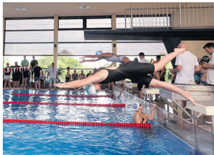
Rund 300 Schwimmerinnen und Schwimmer gingen bei den Wettkämpfen an den Start.

zahlreichen Zuschauer ließen sich davon die Stimmung nicht verderben. Für viele Kinder war es der erste Schwimmwettkampf überhaupt. Entsprechend groß waren die Aufregung und die Nervosität vor dem Start, bevor erste Wettkampferfahrungen gesammelt wurden. Besonders erfolgreich präsentierten sich die Nachwuchsschwimmerinnen und Nachwuchsschwimmer des VFS Rödermark Neben