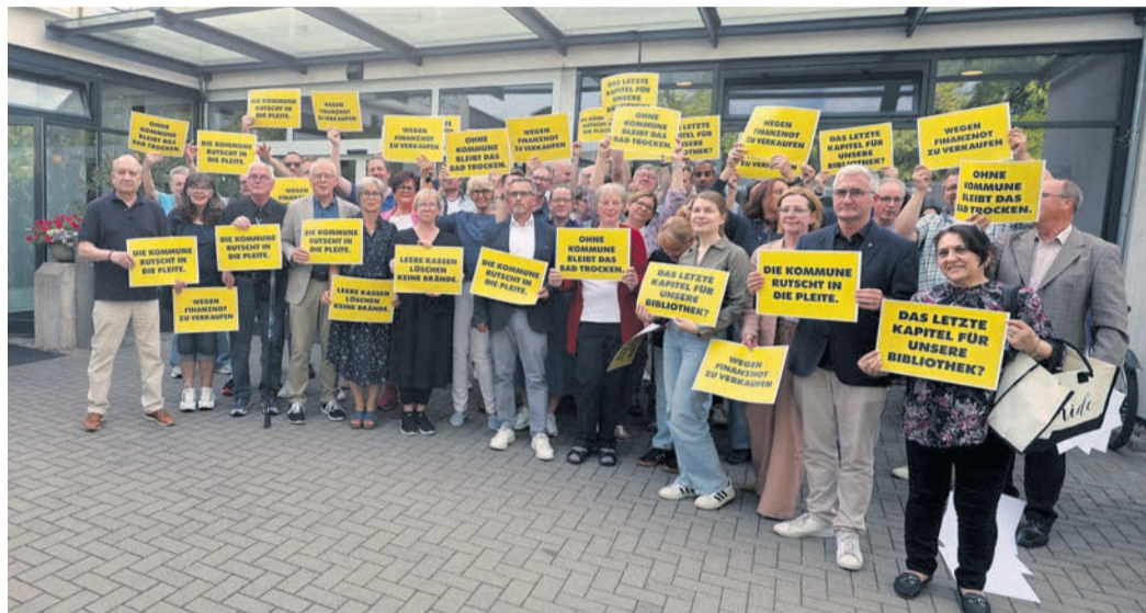
Vor der Sitzung stellten sich die Stadtverordneten und der Magistrat zu einem Gruppenbild auf, um gemeinsam auf die Finanznot der Kommunen aufmerksam zu machen.

Rödermark (PS) - Die Stadtverordnetenversammlung hat mit den Stimmen von CDU und Andere Liste/Die Grünen erwartungsgemäß eine erneute Grundsteuererhöhung beschlossen. Der Hebesatz für die erst im vergangenen Jahr angehobene Grundsteuer B für Grundstücksbesitzer steigt rückwirkend zum 1. Januar von 990 auf 1.327 Punkte. Der Hebesatz der Grundsteuer A für Land- und Forstwirte wurde von 175 auf 900 Punkte angehoben. AfD, SPD, Freie Wähler und FDP stimmten gegen die Erhöhungen. Zur Überbrückung drohender Liquiditätsengpässe beschloss das Parlament außerdem einstimmig, über den bestehenden Kreditrahmen hinaus bis zu einer Obergrenze von fünf Millionen Euro sogenannte Liquiditätskredite aufnehmen zu dürfen. Die Stadtverordneten führten im Mehrzweckraum der Halle Urberach eigentlich eine klassische Haushaltsdebatte mit längeren Reden der Fraktionsvorsitzenden, beschlossen wurde der Haushalt für das laufende Jahr aber nicht. Wie nach einer Sondersitzung des Haupt-, Finanz- und Wirtschaftsförderungsausschusses in der Woche zuvor absehbar war, nahmen die Stadtverord-