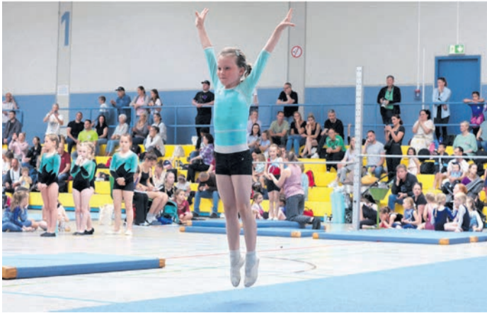
Rund 700 Turnerinnen und Turner waren mit dabei.

Rund 700 Teilnehmer waren an den beiden Tagen insgesamt dabei. Vor allem am Samstag herrschte beim Gaukinderturnfest in den beiden städtischen Sporthallen in der Kapellenstraße und auf dem Außengelände der angrenzenden Nell-Breuning-Schule Hochbetrieb. Der Nachwuchs fieberte den Wettkämpfen entgegen. Kinder der Jahrgänge 2013 bis 2020 zeigten ihr Können beim Gaukinderturnfest in altersgerechten Wettkämpfen. Bei den sogenannten Wahlwettkämpfen bestand auch die Möglichkeit, Turnen mit anderen Sportarten, etwa aus der Leichtathletik, zu kombinieren. Erfolgreichster Verein beim Gaukinderturnfest, das