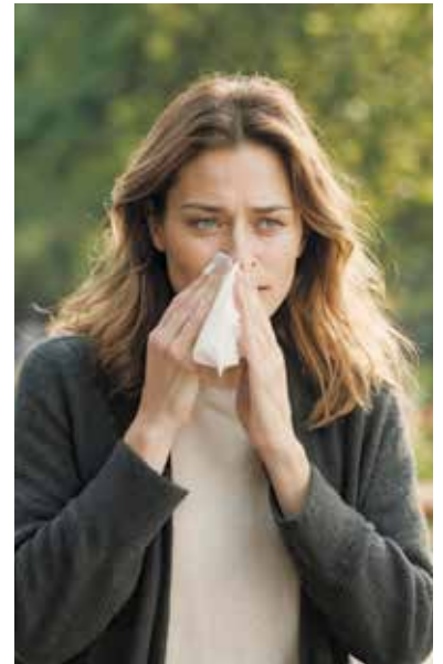
Niesattacken und eine laufende Nase belasten viele Allergikerinnen und Allergiker inzwischen nicht nur im Frühling, sondern fast das ganze Jahr hindurch.

Darüber hinaus lässt sich die Allergenbelastung im Alltag reduzieren, etwa durch Lüften zu pollenarmen Zeiten oder das Wechseln der Kleidung nach dem Aufenthalt im Freien.