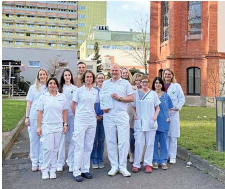
Interdisziplinäres Team des Brustzentrums an der Asklepios Paulinen Klinik Wiesbaden.

Das Brustzentrum verfügt über sämtliche modernen diagnostischen Verfahren zur präzisen Abklärung von Brustbefunden – darunter hochauflösender Ultraschall, Mammographie, MRT, CT, PET-CT, Knochenszintigrafie sowie minimalinvasive Biopsietechniken. Die Ergebnisse fließen in eine individuell abgestimmte Therapiepläne