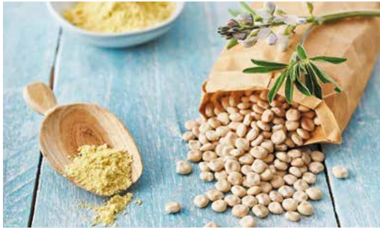
Hülsenfrüchte wie die Weiße Lupine tragen zu einer ausgewogenen Ernährung bei.

Entscheidend für die ökologische Wirkung ist, was im Boden passiert. Hülsenfrüchte leben in Symbiose mit Knöllchenbakterien, die Stickstoff aus der Luft im Boden binden und der Pflanze verfügbar machen. Diese Kulturen versorgen sich so selbst auf natürliche Weise mit „Dünger“. Nach der Ernte bleibt Stickstoff in Pflanzenresten und Wurzeln zurück, wovon die Folgekultur profitiert. Weniger Mineraldünger bedeutet weniger Energieeinsatz und weniger Treib-