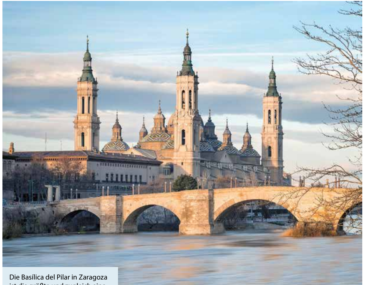
Die Basílica del Pilar in Zaragoza ist die größte und zugleich eine der wichtigsten Barockkirchen Spaniens.

In Spanien ist es heute so einfach wie nie, mit dem Zug zu reisen. Urlauber haben dies vor allem der Liberalisierung des Eisenbahnmarkts zu verdanken, inzwischen fahren mehrere Anbieter auf denselben Strecken. Das hat die Preise deutlich gesenkt und macht das Reisen auf Hochgeschwindigkeitsstrecken oft um einiges günstiger als in anderen europäischen Ländern. Ist man in Madrid gelandet, gibt es zwei Möglichkeiten zum Starten: Den Bahnhof Puerta de Atocha-Almudena Grandes im Süden (kurz Atocha) und den Bahnhof Chamartín-Clara Campoamor (kurz Chamartín) im Norden. Von ihnen gehen die großen Bahnlinien Spaniens aus – und je nach Ziel wählt man den einen oder den anderen.