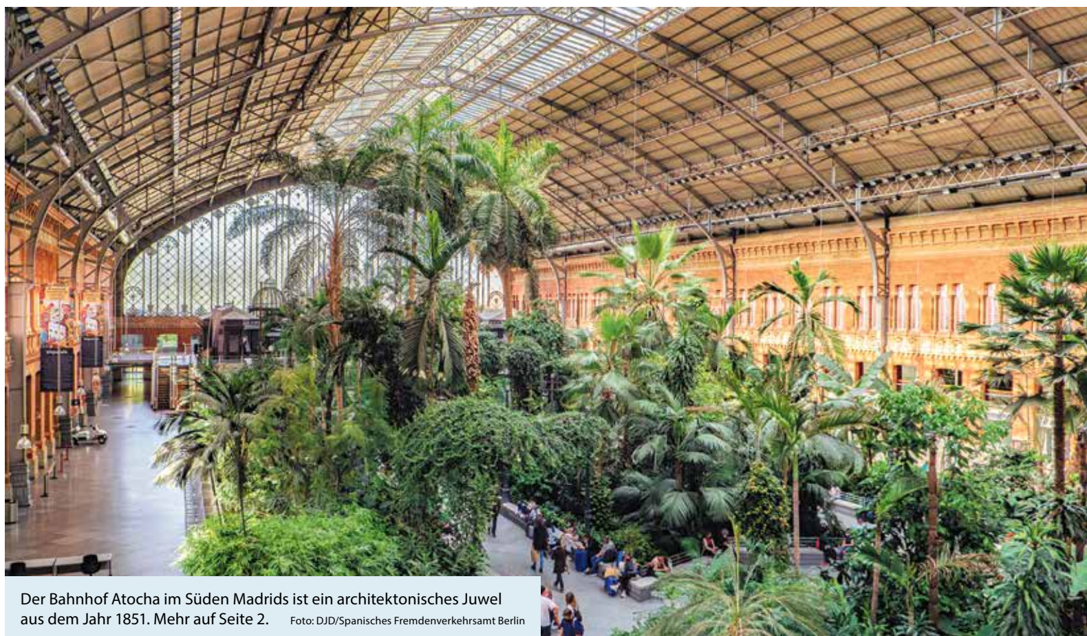
Der Bahnhof Atocha im Süden Madrids ist ein architektonisches Juwel aus dem Jahr 1851. Mehr auf Seite 2.

Bahn frei für Spanien Das Lieblingsreiseland der Deutschen lässt sich entspannt mit dem Zug entdecken