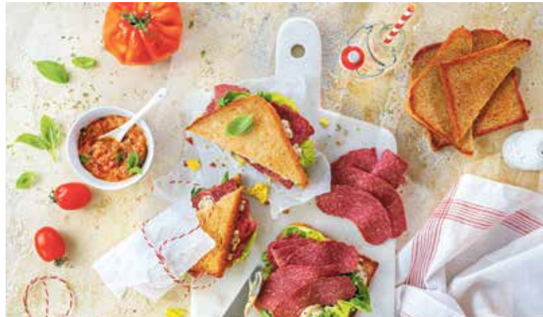
Einfach zum Reinbeißen: Ein Sandwich Salami-Style mit frischem Salat und pikanter Creme geht immer.

Vegane Snack Balls mit veganem Bacon umwickeln, auf Holzspieße