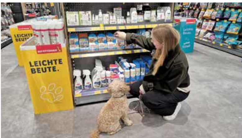
Vorbeugung muss sein: Im örtlichen Tierfachhandel gibt es verschiedene Optionen für einen Schutz vor Zeckenbissen.

hinweg aktiv. Wer sich fachkundig beraten lässt und das Tier schützt, reduziert das Infektionsrisiko“, betont Nadine Giese-Schulz von Das Futterhaus. Ein individueller Schutz, abgestimmt mit der Tierarztpraxis, ist daher unverzichtbar. Wichtig sind eine tägliche Fellkontrolle nach jedem Spaziergang sowie eine hochwertige Zeckenzange für schnelle Hilfe. Unter www.futterhaus.de gibt es mehr Tipps.