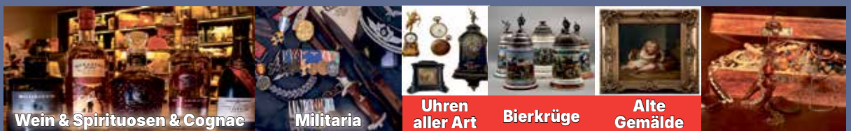
Wein & Spirituosen & Cognac