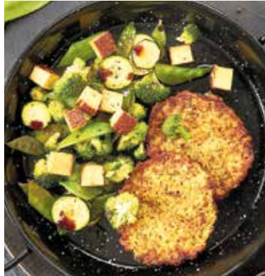
Die krossen Gemüsetaler mit Pfannengemüse und Tofu sind im Nu zubereitet.

(DJD). Wenn Kinder mit am Tisch sitzen, kann das gemeinsame Essen schonmal zur Herausforderung werden: Viele Eltern legen Wert auf Gerichte, die gesund sind und eine bewusste, pflanzenbetonte Ernährung unterstützen. Vegane Mahlzeiten haben daher längst ihren Platz in der Familienküche gefunden. Kinder stehen diesen erstmal oft skeptisch gegenüber. Doch dafür gibt es bei diesem Gericht gar keinen Grund: Die Gemüsetaler aus Kartoffeln sind knusprig-heiß, voller Aroma und überzeugen auch kleine Esser. Der Gemüsetaler ist mit Zwiebeln, Karotten und Sellerie verfeinert. Räuchertofu in der Beilage sorgt für den Umami-Geschmack. Und das Beste: Die Taler gibt es pfannenfertig zu kaufen und sind in wenigen Minuten bereit zum Wegknuspern. Man kann sie in der Pfanne, im Backofen, in der Heißluftfritteuse oder sogar auf dem Grill zubereiten.