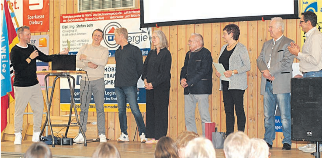
Die Ehrungen für 50 Jahre dauerten aufgrund vieler Anekdoten und Fotos fast eine Stunde, auch weil es über Jörg Roßkopf (Zweiter von links) eine Menge zu erzählen gab.