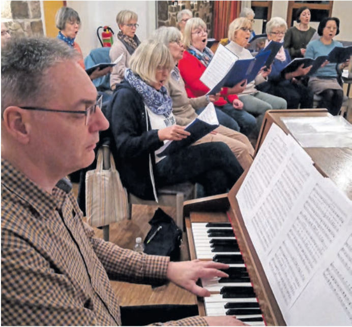
Der katholische Kirchenchor “St. Valentin” ist fleißig am Üben für seine Adventskantate zum 95-jährigen Jubiläum.