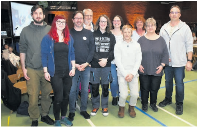
Sowohl bei der Münsterer Gemeinde- als auch bei der Altheimer Ortsbeirats-Wahl zählte die neue Wählergemeinschaft klar! (hier ihre Vertreter auf der Wahlveranstaltung der DJK Münster) zu den Gewinnern. In seiner ersten Wahlperiode geht klar! in Münster nun direkt eine Partnerschaft mit der CDU ein und wird in Altheim Ortsvorsteher stellen.

Münster (jedö) In Münster will in den kommenden fünf Jahren ein neues Bündnis die Ortspolitik prägen: Die CDU und die Wählergemeinschaft klar! haben für die neue Wahlperiode eine feste Zusammenarbeit vereinbart. Die soll in der konstituierenden Sitzung der Münsterer Gemeindevertretung am kommenden Montag (27., 19 Uhr, ausnahmsweise in der Kulturhalle statt im Rathaus-Saal) beginnen. Der neue Altheimer Ortsbeirat muss sich bis zu seiner Premierenitzung am 4. Mai (18 Uhr, Gustav-Schoeltzke-Haus) noch eine Woche länger gedulden. In Münster ist klar! erst im Herbst 2025 auf die Bühne getreten. Ohne den Streit um den (per Bürgerentscheid nun verhinderten) Bau zweier Lärmschutzwände an der Bahnstrecke Darmstadt-Aschaffenburg westlich des Altheimer Bahnhofs wäre die Wählergemeinschaft wohl nicht entstanden. Aus Reihen der Gegner der Wände formierte sich klar! jedoch wenige Wochen vor Einreichungsfrist der Listen