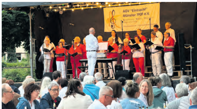
Vergangenes Wochenende stand La Musica beim Chorfestival des AGV Eintracht Münster auf der Bühne.