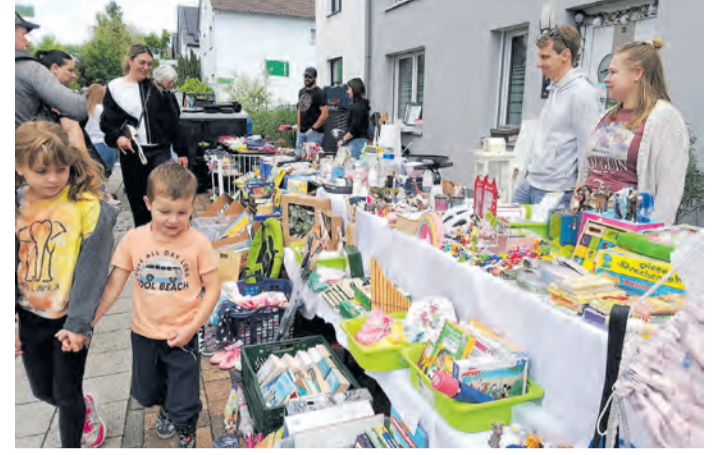
Die Auslagen beim Hofflohmart waren groß, genauso wie die Zahl derer, die kaufen oder nur schauen wollten.

“Mit dem Hofflohmart bot sich für uns ein guter Ersatz für den Basar der Jugendförde-