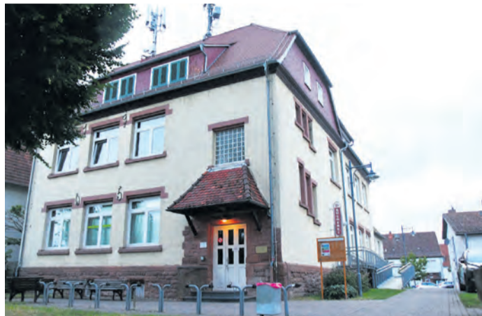
Das Alheimer Gustav-Schoeltzke-Haus muss in mehrfacher Hinsicht saniert werden. Dies könnte bis zu 2,3 Millionen Euro kosten. Ein Verkauf des denkmalgeschützten Ensembles durch die Gemeinde ist dennoch unwahrscheinlich. Eher dürfte es auf eine Instandsetzung auf Pump hinauslaufen.

(jedö) Das Gustav-Schoeltzke-Haus in Altheim treibt derzeit mehrere Gremien in Münster und seinem Ortsteil um. Am Freitag beriet der neue Alheimer Ortsbeirat in eben jener Immobilie über deren Zukunft, am Montag war das kommunale Objekt dann Thema in der Münsterer Gemeindevertretung. Für Mittwoch wurde außerdem noch ein gemeinsamer Ortstermin von Bau-, Planungs- und Umweltausschuss sowie Haupt- und Finanzausschuss angesetzt. Aktueller Grund für die Debatte ist der Sanierungstau im 1905 errichteten Multifunktionsgebäude.