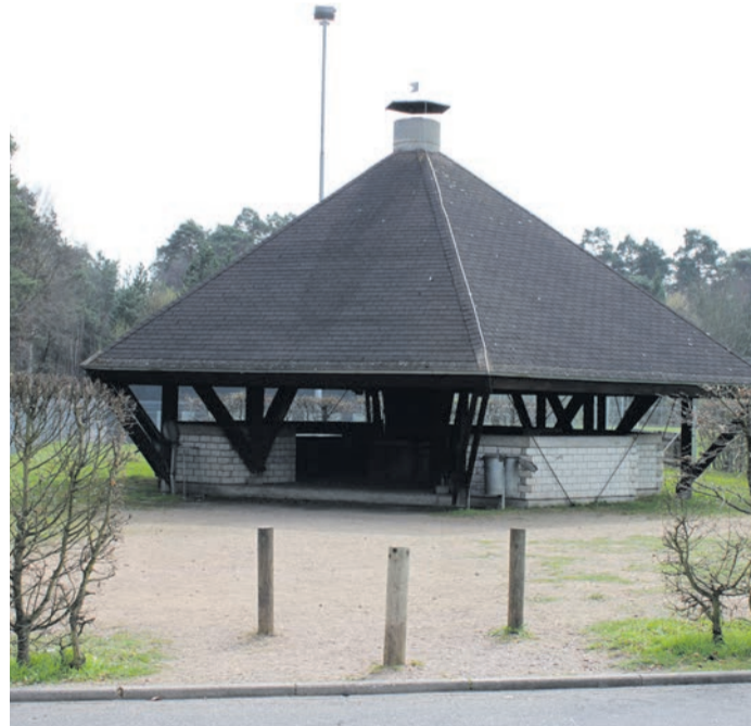
Grillhütte am Kultur- und Sportzentrum Martinsee.

Heusenstamm (NZH) Heusenstamm treibt die Digitalisierung weiter voran: Mit dem neuen Raumbuchungssystem Locaboo können Vereine, Interessensgemeinschaften sowie Dauermieterinnen und -mieter städtische Räume und Liegenschaften seit August vergangenen Jahres vollständig online verwalten und buchen. Seit einigen Tagen ist zudem ein weiterer Service freigeschaltet: Die Grillhütte im Außengelände des Kultur- und Sportzentrums Martinsee (Martinseestraße 2) kann nun auch von Privatpersonen und Vereinen bequem online reserviert werden. Der Ablauf ist bewusst einfach gehalten: Nach einer einmaligen Registrierung lassen sich freie Zeiten einsehen und Buchungen mit wenigen Klicks vornehmen. Erste Reservierungen sind bereits eingegangen – und das ganz ohne vorherige öffentliche Ankündigung. Locaboo bündelt als moderne, KI-gestützte Plattform alle Schritte von der Anfrage über die Genehmigung bis zur Abrechnung in einem System. Das reduziert Abstimmungsaufwand und sorgt für mehr Transparenz. Statt zahlreicher E-Mails oder Telefonate erfolgt die Kommunikation zentral