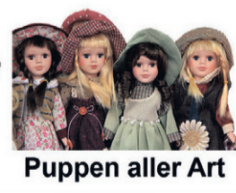
Puppen aller Art