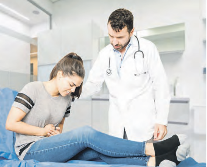
Ärzte-Odyssee: Laut eines deutschen Arztreports dauert es oftmals bis zu 8 Jahre, bis die Diagnose Reizdarm gestellt wird.

Um eine Antwort auf diese Frage zu bekommen, führten sie eine wissenschaftliche Studie nach dem höchsten wissenschaftlichen Standard, dem sogenannten Goldstandard, durch. Das Ergebnis war ebenso beeindruckend wie eindeutig: Bei den Patienten mit einem Reizdarm, die den speziellen Bakterienstamm bekommen hatten, konnte eine um ein Vielfaches höhere Verbesserung der Beschwerden festgestellt werden als in der Kontrollgruppe