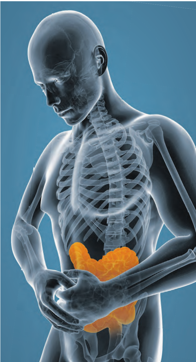
Die Ursache des Reizdarmsyndroms ist häufig eine geschädigte Darmbarriere. Durch sie können Erreger und Schadstoffe in die Darmwand eindringen und das enterische Nervensystem reizen.

Ein Reizdarmsyndrom äußert sich in wiederkehrenden Darmbeschwerden wie Durchfall, Bauchschmerzen, Blähungen und Verstopfung, welche im Wechsel, in Kombination oder auch einzeln auftreten können und in ihrer Intensität, Häufigkeit und Dauer variieren. Für Betroffene stellt dies eine erhebliche Belastung im