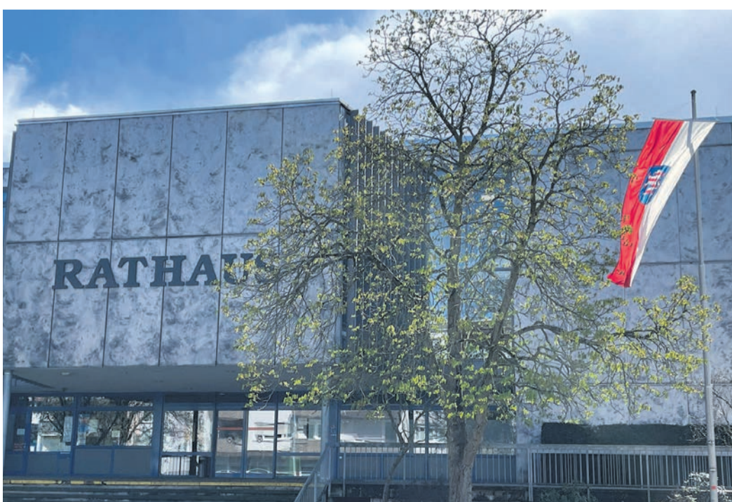
Sonderbeflaggung vor dem Rathaus zum Jubiläum 80 Jahre Hessen.

Hessen war nach dem Zweiten Weltkrieg das erste Bundesland, das sich eine demokratische Verfassung gab. Unter Mitwirkung der Bürgerinnen und Bürger entstand diese im Jahr 1946 und sie wurde am 1. Dezember desselben Jahres per Volksabstimmung mit großer Mehrheit angenommen. Seitdem bildet sie das Fundament der demokratischen Ordnung des Landes.