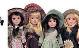
Puppen aller Art