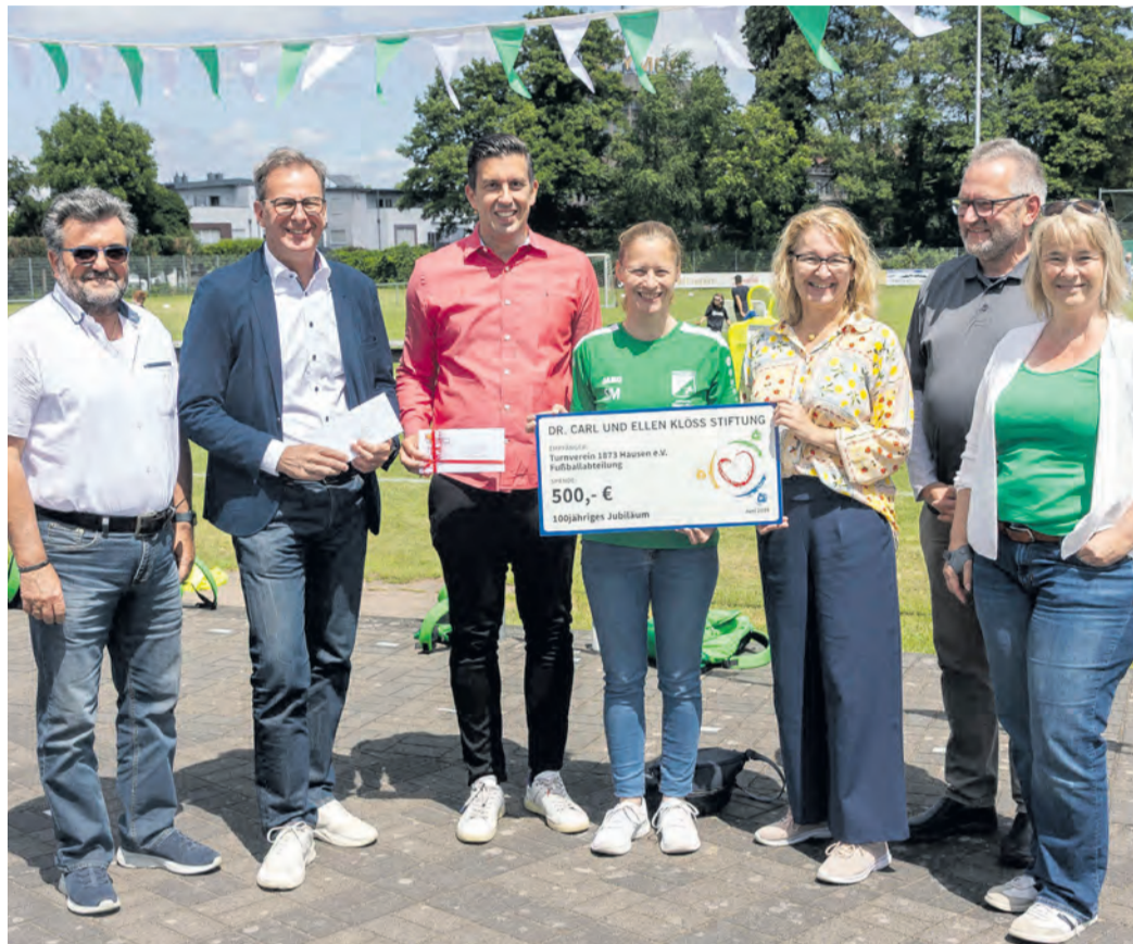
Die Dr. Carl und Ellen Klöss Stiftung überreichte 500 Euro für die Vereinsarbeit.