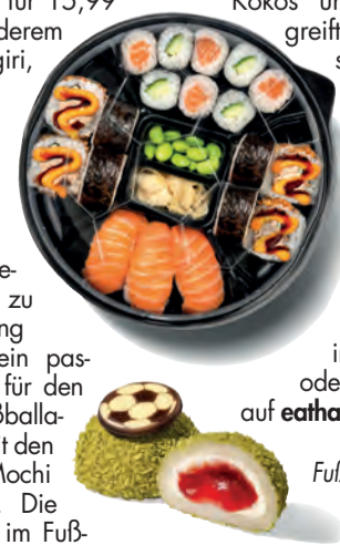
Fußball Fan Box und Volltreffer Mochi

ball-Design (3,99 Euro) überzeugen optisch und geschmacklich: Die Kombination aus Matcha, Kokos und Erdbeer-Füllung greift aktuelle Geschmackstrends auf. Außen weich, innen cremig und angenehm erfrischend sind sie ein origineller WM-Snack. Sushi-Box und Mochi sind ab dem 2. Juni 2026 im Eat Happy Shop oder zum Vorbestellen auf eathappy.de erhältlich.