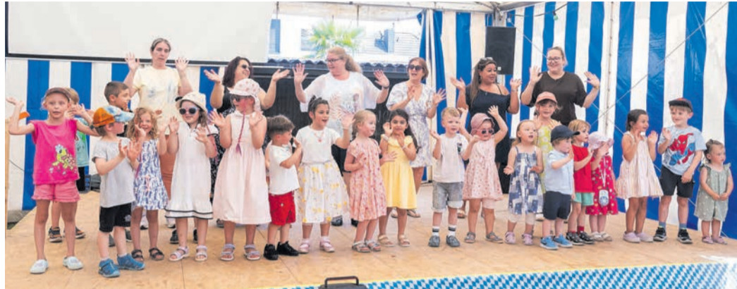
Auch die Kinder der katholischen Kindertagesstätten trugen mit mehreren Liedvorträgen zur Unterhaltung bei und erhielten dafür viel Applaus.

Bereits am Samstagabend begann das Pfarrfest mit einem abwechslungsreichen Programm. Die katholische Jugend hatte zu einem Abend mit