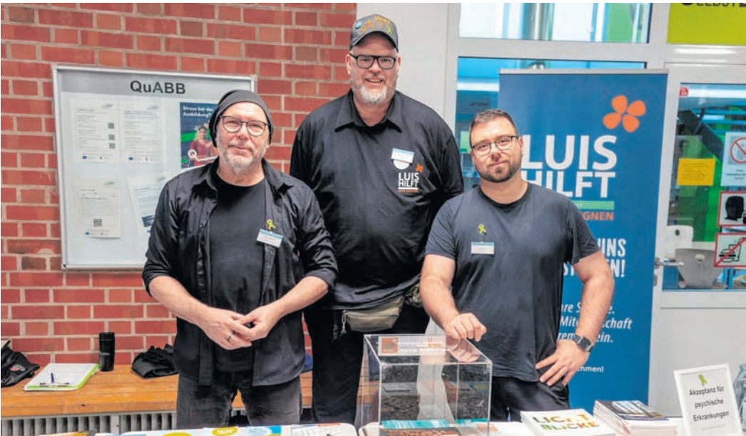
An zahlreichen Ständen konnten sich Interessierte rund um das Thema Gesundheit bei der Auftaktveranstaltung der Obertshausener Gesundheitstage informieren. Mit dabei waren unter anderem der Selbsthilfeverein LUIS HILFT.