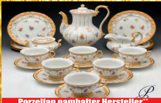
Porzellan namhafter Hersteller**