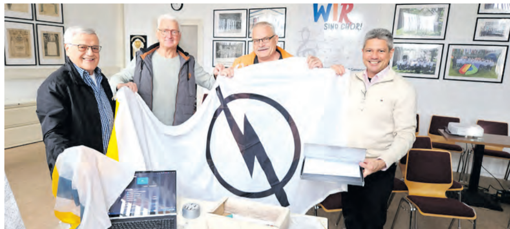
Opel-Fahnen, wie diese begrüßten Mitarbeiter und Besucher am Opel Prüffeld. Seit heute wird eine bei HGKiD aufbewahrt.

Da die Heimatkundler keinen großen Raum für Vorträge haben, hatte der Gesangsverein Germania seinen Übungsraum