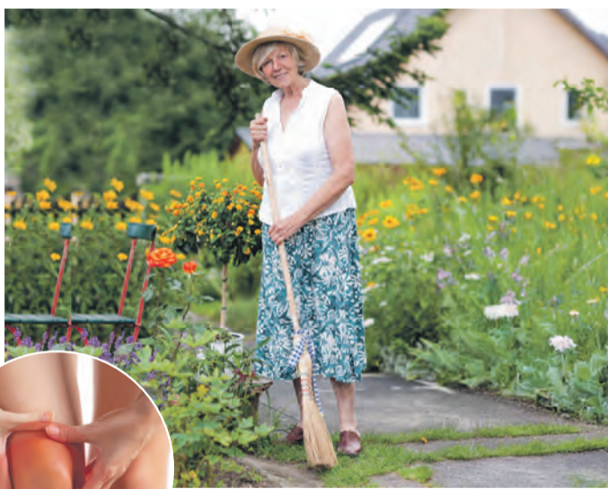
Alein in Deutschland leiden rund 20 Millionen Menschen unter rheumatischen Erkrankungen. Diese zählen zu den häufigsten Ursachen für Gelenkschmerzen.