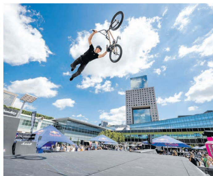
Auf der EUROBIKE 2026 vom 24. bis zum 27. Juni sieht man das ganze Spektrum von den Radherstellern, Zubehöranbietern bis zu den Nutzern jeder Altersklasse.

Die Messe ist längst mehr als eine klassische Produktschau. Im Mittelpunkt stehen Trends, Innovationen und die Frage, wie Mobilität künftig aussehen kann. Nachhaltige Verkehrskonzepte, Radreisen, urbane Fortbewegung und das Fahrrad als Alltagsbegleiter spielen dabei eine immer größere Rolle. Damit richtet sich die EUROBIKE nicht nur an sportliche Radfahrer, sondern auch