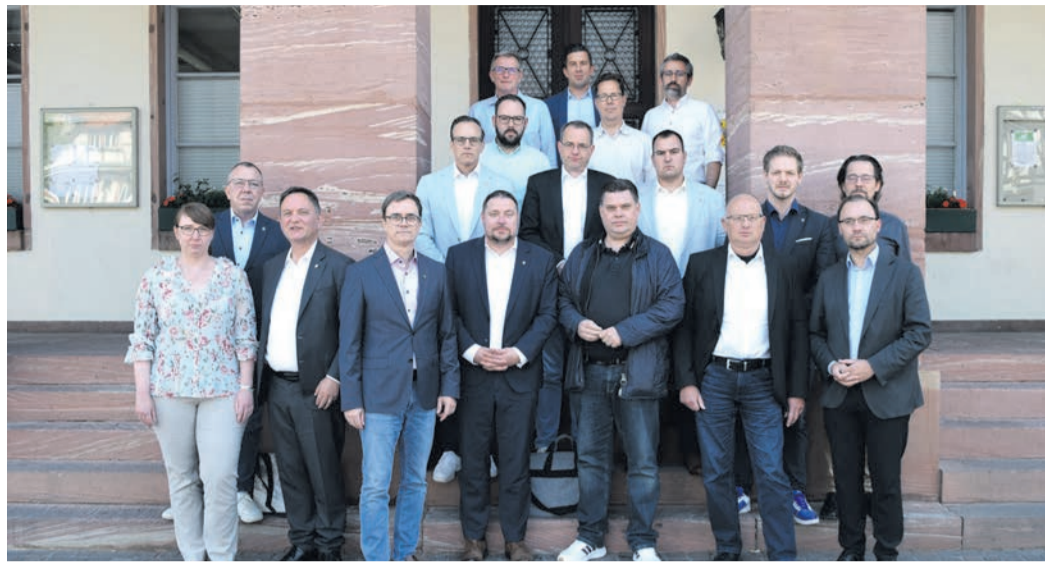
Gruppenfoto der Bürgermeister und Hauptamtlichen des Kreises Offenbach.

„Bund und Land sind dringend gefordert, die finanzielle Ausstattung der Kommunen endlich nachhaltig zu verbessern. Ohne grundlegende Reformen drohen weitere erhebliche Belas-