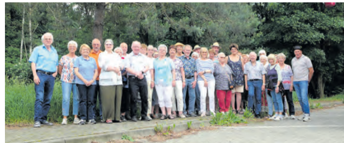
Weitere Höhepunkte der Reise waren die Saarschleife bei Mettlach und der Rosengarten in Zweibrücken.

Jügesheim (RZ) Ende Mai waren knapp 40 Mitglieder und Freunde der Kolpingsfamilie Jügesheim mit einem Reisebus unterwegs im Saarland und Umgebung. Bei hochsommerlichen Temperaturen und unter jeweils fachkundiger Führung wurden die Städte Trier, Saarbrücken und Luxemburg sowie die Völklinger Hütte besucht.