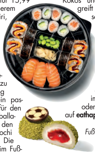
Fußball Fan Box und Volltreffer Mochi

ball-Design (3,99 Euro) überzeugen optisch und geschmacklich: Die Kombination aus Matcha, Kokos und Erdbeer-Füllung greift aktuelle Geschmackstrends auf. Außen weich, innen cremig und angenehm erfrischend sind sie ein origineller WM-Snack. Sushi-Box und Mochi sind ab dem 2. Juni 2026 im Eat Happy Shop oder zum Vorbestellen auf eathappy.de erhältlich.